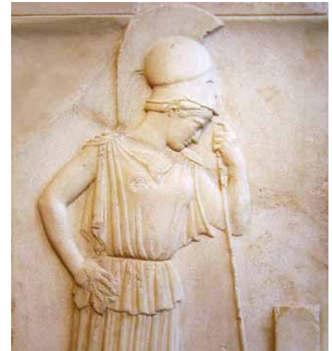
Fotografía: Atenea Pensativa (relieve). Museo de la Acrópolis, Grecia.