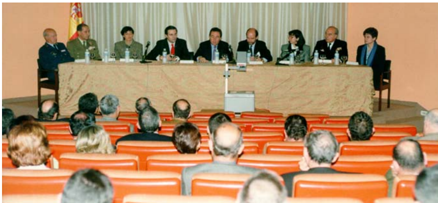
Sesión de apertura de las Jornadas, presidida por el Subsecretario de Defensa, con la participación del Director General del Libro, Archivos y Bibliotecas, del Ministerio de Educación y Cultura y del Director General del Gabinete del Ministro de Defensa

momentos las conferencias se han alejado un poco de la realidad de los archivos, por lo que deberíamos reflexionar sobre el