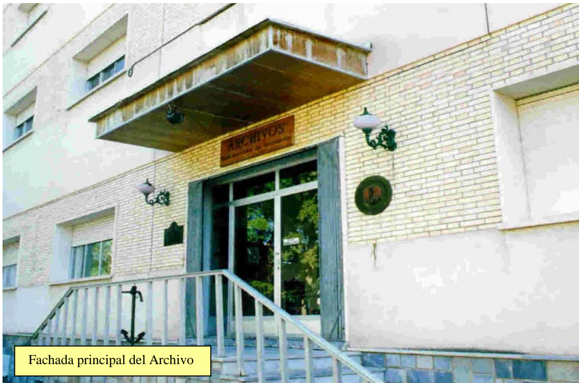
Fachada principal del Archivo

De otro tipo, podemos destacar, entre otras, la serie de " Expedientes Testamentarios ", correspondientes en una muy