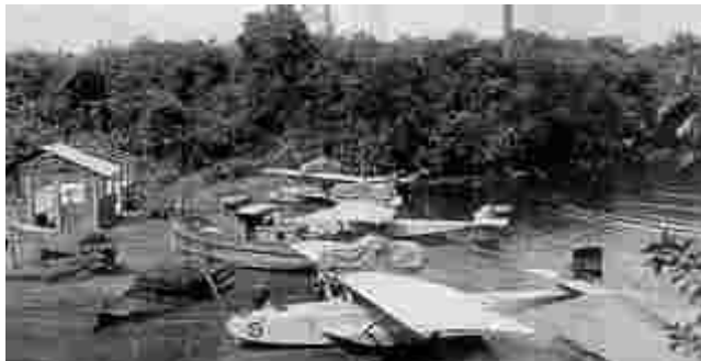
Hidros de la Patrulla Atlántida, 1926.

El Servicio Histórico y Cultural del Ejército del Aire cedió la sala de cine para que durante los días 17 al 21 de Julio