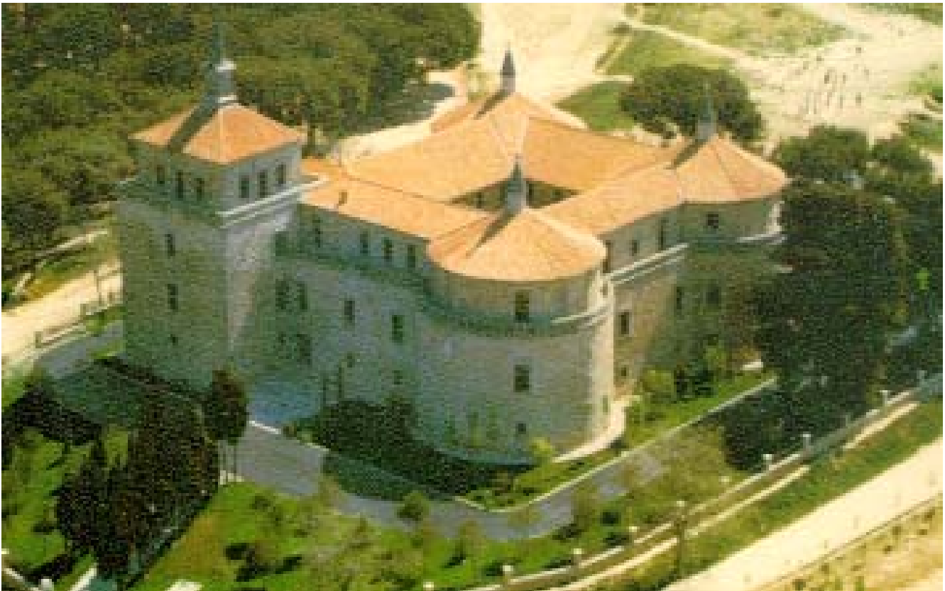
Castillo de Villaviciosa de Odón.

Al finalizar esta sesión no quedaba más que clausurar el Curso, procediendo a ello el Viceconsejero de Promoción y Patrimonio Histórico de la Comunidad Autónoma de Madrid.