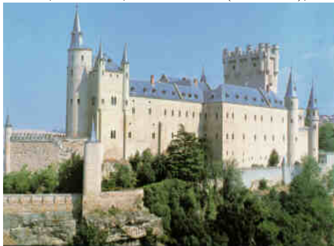
Archivo General Militar de Segovia

un archivo central que para uno intermedio o histórico, no requiere utilizar todos los módulos ni cumplimentar todos los campos de los distintos formularios, aunque obviamente algunos, los mínimos imprescindibles para la consistencia del sistema archivístico, son obligatorios.