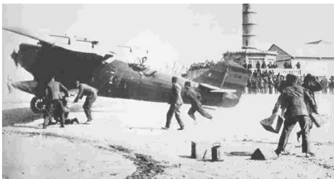
Breguet XIX de la Patrulla Elcano, 1926.

censados, la escasa comunicación entre ellos, la falta de formación investigadora, la falta de difusión de sus fondos para el gran público, etc.