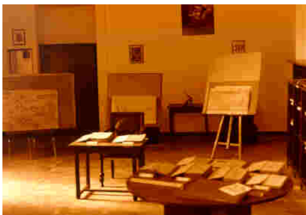
Sala de investigadores y de trabajo