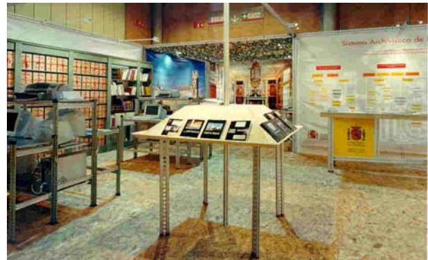
Plano general del Stand.