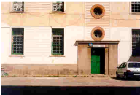
Fachada principal del Archivo