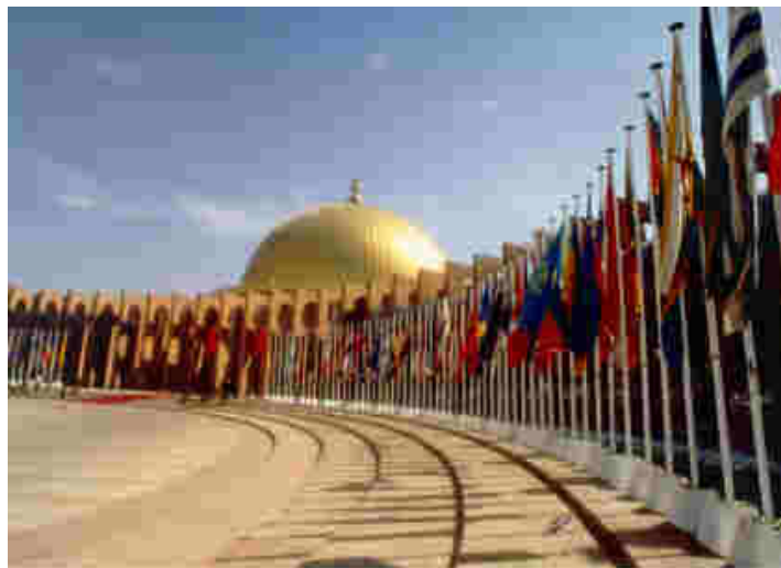
Entrada al Palacio de Congresos y Exposiciones de Sevilla

El próximo Congreso tendrá lugar en Viena en el 2004. Hay que ser previsores e ir preparando las aportaciones.