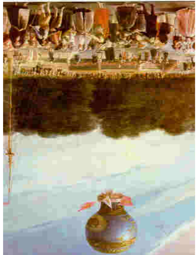
Óleo de Antonio Carnicero. Museo del Prado.

Patrimonio Histórico de Castilla y León, con el Secretario General de la Fundación "Las Edades del Hombre" de Valladolid y con la Directora de la Fundación "Madrid Nuevo Siglo".