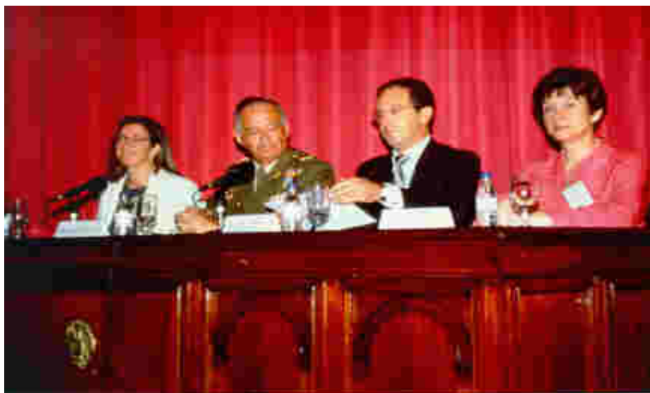
Acto inaugural de las IV Jornadas de Archivística Militar