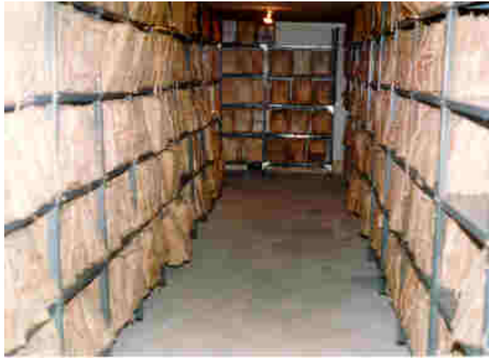
Depósito nº 4