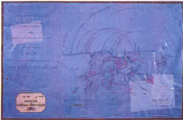
Proyecto, a escala 1:50.000, de batería de barlovento de la plaza de La Habana, con plano de costas y radio de acción de las baterías, que se conserva en el Servicio Histórico Militar. Fue firmado en 1897 por el capitán de Ingenieros José García de los Ríos.