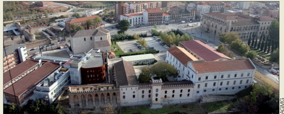
Vista aérea de las instalaciones del Archivo General Militar de Guadalajara

Otros de los fondos que se encuentran disponibles en Guadalajara son la documentación relacionada con las Milicias Provinciales de Canarias, los expedientes personales de las unidades, centros y organismos disueltos, los testimonios del Consejo Supremo de Justicia Militar y los expedientes de la Dirección General de Mutilados.