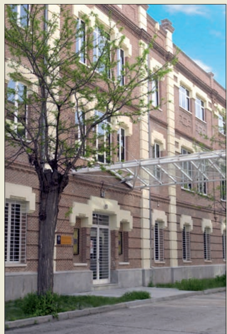
Fachada principal del Archivo

Para finalizar, el Archivo dispone de una colección de 12.069 fotografías antiguas, fechadas entre 1854 y 1936.