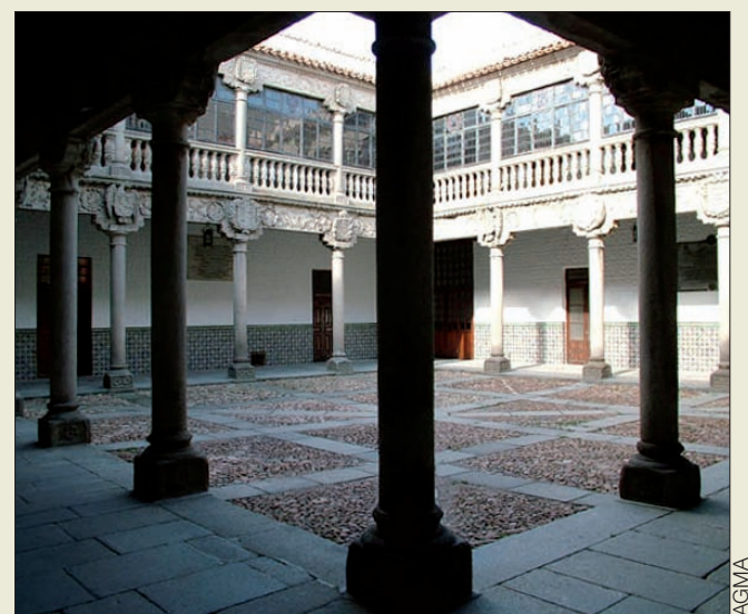
Patio del Palacio de Polentinos, sede del Archivo

Dentro de la estructura del Subsistema Archivístico del Ejército de Tierra, en el Palacio de Polentinos se conserva actualmente la documentación más contemporánea, con excepción de los expedientes personales.