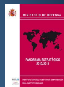
Documento de análisis “Panorama Estratégico 2010/2011”