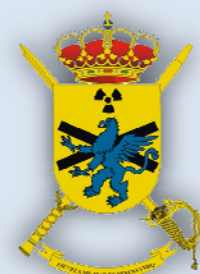
(Escudo de la EMDNBQ)

El temor a sufrir un ataque terrorista con agentes nucleares, radiológicos, biológicos o químicos en los países occidentales (incluida España) es un hecho. Y, aunque tanto el Ejército como las FCSE disponen de personal especializado y los medios de protección necesarios ante este tipo de amenaza, lo cierto es que hay otros muchos actores que deben estar preparados para gestionar un incidente así. Aquí se incluyen bomberos, servicios de emergencias y sanitarios y cuerpos policiales autonómicos, entre otros.