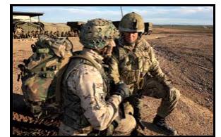
Paracaidistas británicos y españoles

El ejercicio combinado, se desarrolló del 22 de noviembre al 3 de diciembre de 2012.