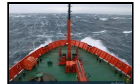
Base Juan Carlos I - Mar de Hoces - Armada española.