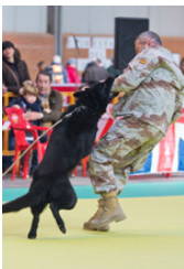
Instructor en una demostración.