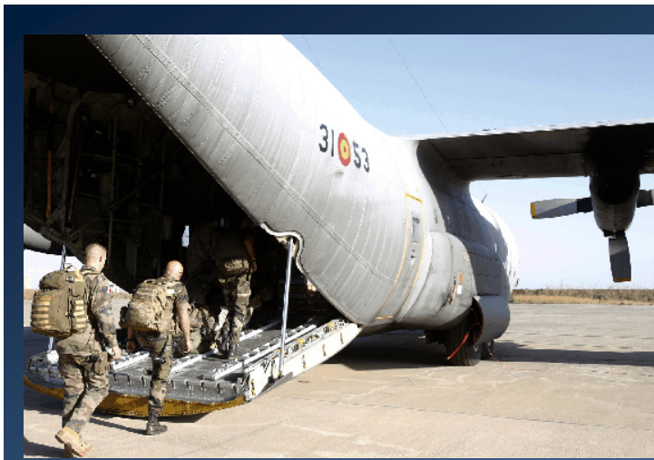
Misión de Mali Dakar, Senegal. (Enero de 2013)