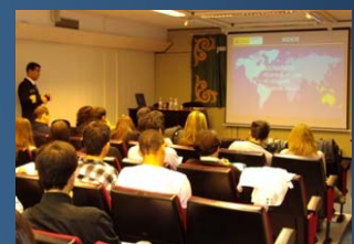
Aula del IEEE