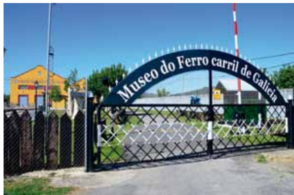
Entrada al actual emplazamiento del Tren Histórico de las FAS, en la localidad lucense de Monforte de Lemos.

El proyecto del tren histórico prevé que el convoy recorra las líneas ferroviarias españolas en ocasiones señaladas,