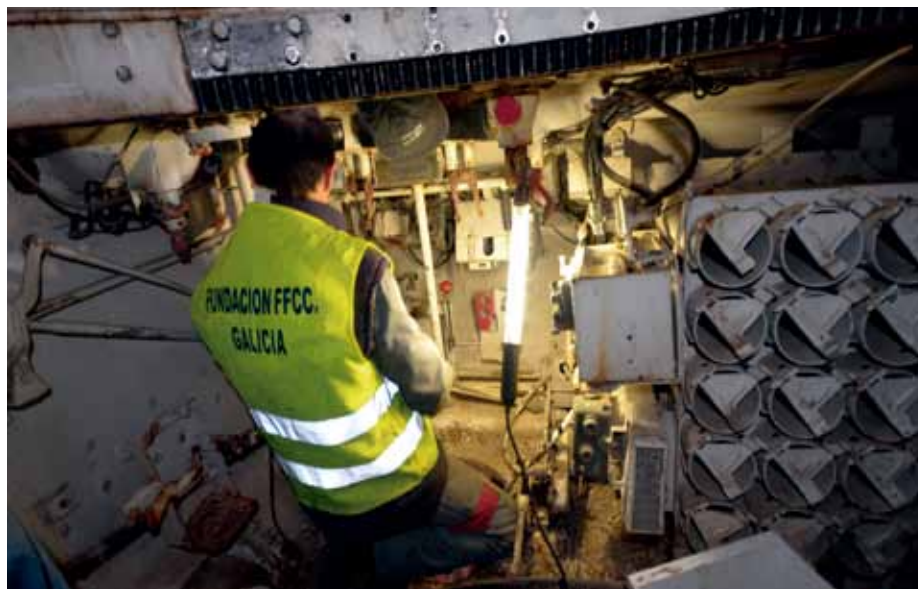
Los trabajos de restauración llevados a cabo en la institución gallega también están abiertos a la curiosidad de los visitantes, que pueden seguir sus evoluciones en sala.

No obstante, Oliver asegura que «todos lo ven con buenos ojos, les gustaría acometer el proyecto, pero nos