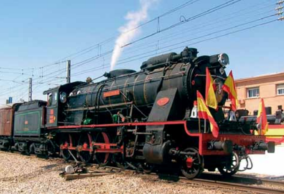
Arriba, la locomotora del tren de la FAS. Debajo, interior del coche Díez-Alegría.