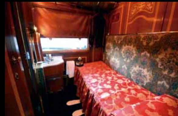
Panorámica y recreación del dormitorio de la unidad en la que viajó desde Estoril Su Majestad el Rey.

una labor casi artesanal y sólo puede estar un trabajador en su interior.