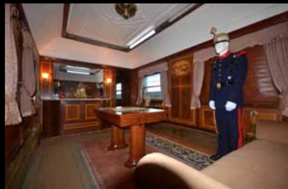
El vagón del Lusitania Expresso en el que llegó Don Juan Carlos a España en 1948 forma parte del proyecto ferroviario.