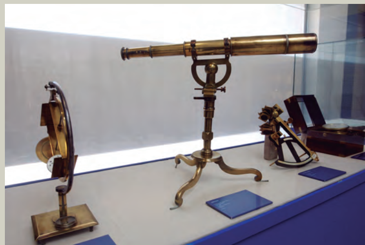
Instrumentos de navegación que recuerdan que, en sus inicios, la utilidad del museo fue la enseñanza de los alumnos de la Escuela Naval.

D OS siglos y cuarto después de que por primera vez se proyectara un museo de marina en San Fernando —o la Isla del León—, su actual museo naval se acomoda estos días a su nueva sede en el Palacio de Capitanía de la localidad.