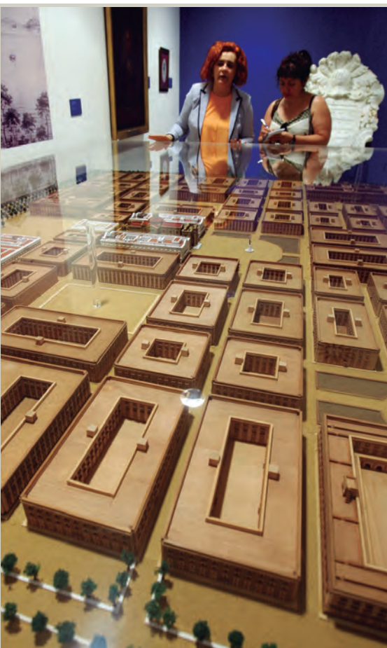
El almirante Cervera «observa» la defensa del Arsenal de La Carraca (1873). Proyecto original de la población militar de San Carlos.