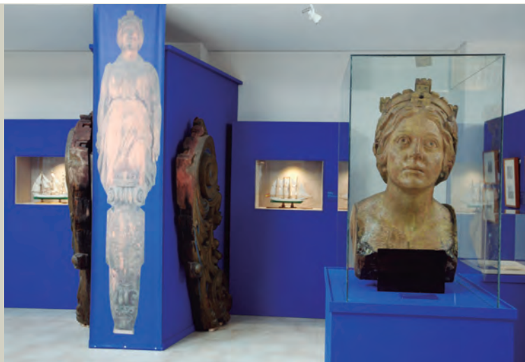
Detalle de la cabeza del primer mascarón del Elcano , detrás sus laterales y una imagen que recrean el conjunto de la pieza frontal del buque escuela.