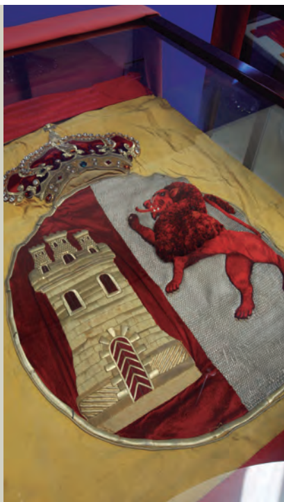
Historia de la navegación a escala. Bandera del acorazado Carlos V. Talla de la Virgen del Rosario, que, según todos los indicios, «acompañó» a Juan de Austria en Lepanto.