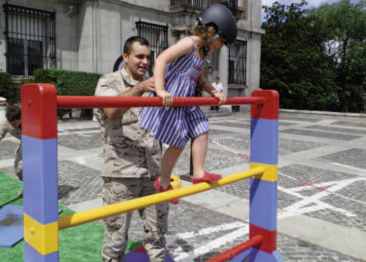
Pista de Aplicación infantil