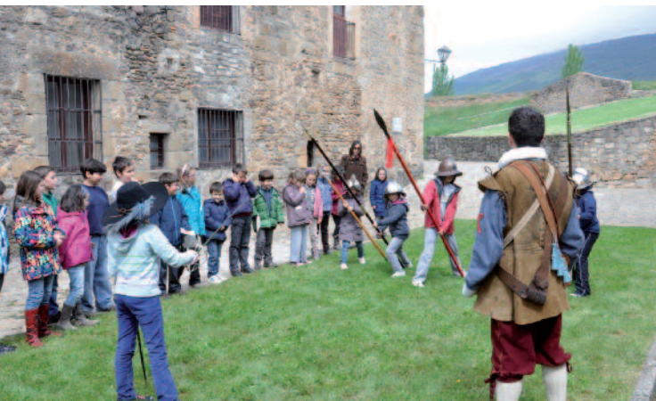
Recreación medieval en el Castillo