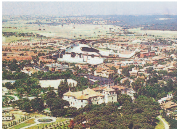
Helicóptero Superpuma sobre Villaviciosa