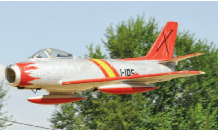
Patrulla de Aeromodelismo