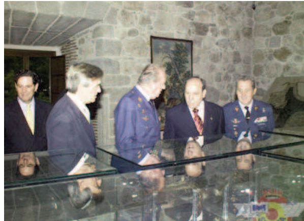
SM el Rey Juan Carlos I en el Castillo