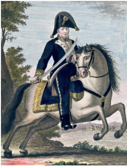
Retrato de Francisco Rovira BNE

E l nombre de Francisco Rovira (1764-1820), Doctor en Teología y Brigadier del ejército español, permanecerá por siempre ligado a uno de los episodios más sorprendentes que tuvieron lugar en tierras catalanas durante la larga lucha contra el dominio napoleónico. En efecto, la recuperación del Castillo de San Fernando de Figueres, la madrugada del 10 de abril de 1811, por medio de un golpe de mano llevado a cabo por las tropas de la División del Ampurdán, constituye una de las páginas más recordadas de la Guerra de la Independencia (1808-1814) en este territorio fronterizo, así como la posterior defensa de la fortaleza durante algo más de cuatro meses frente a un enemigo muy superior.