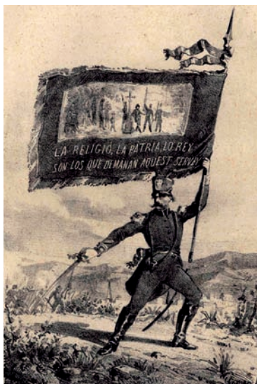
Bandera del batallón de Almogávares