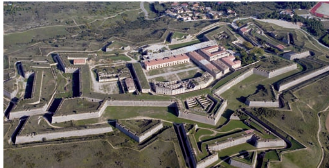
Castillo de San Fernando de Figueres (Girona)

En la muestra se exhibirán importantes fondos de distintas entidades, en especial, un cuadro del Museo del Prado que ha sido recientemente identificado como retrato del mismo Rovira.