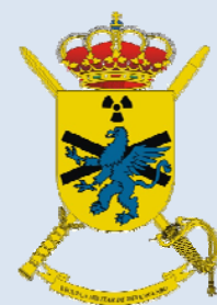
(Escudo de EMDNBQ)

El temor a sufrir un ataque terrorista con agentes nucleares, radiológicos, biológicos o químicos en los países occidentales (incluida España) es un hecho. Y, aunque tanto el Ejército como las FCSE disponen de personal especializado y los medios de protección necesarios ante este tipo de amenaza, lo cierto es que hay otros muchos actores que deben estar preparados para gestionar un incidente así. Aquí se incluyen bomberos, servicios de emergencias y sanitarios y cuerpos policiales autonómicos, entre otros.