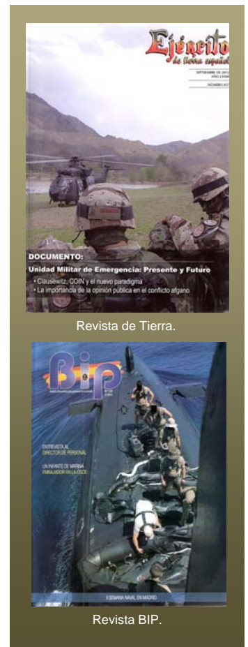
Revista de Tierra.

REVISTA GENERAL DE MARINA.- Contiene numerosos artículos de variadísimos temas relativos a la Defensa, centrándose en el ámbito de la Armada Española.