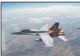
F-18 Hornet (C-15) del ALA 15 en vuelo.